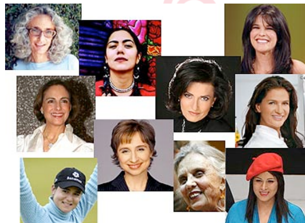
Todas ellas son un orgullo y un ejemplo a seguir para todas las mujeres.

Moda - Ximena Valero: Es la diseñadora que ha puesto en alto a México en el mundo de la moda, al haber ganado el premio al Mejor Diseñador del Año en Fashion Week Miami