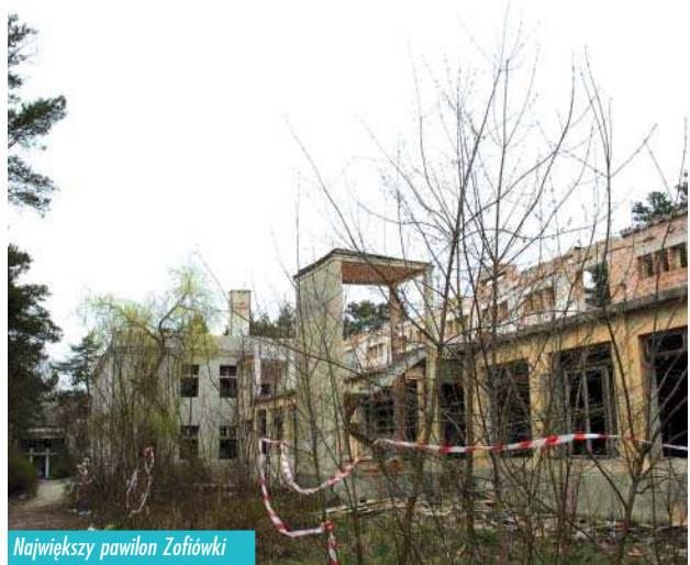
Największy pawilon Zofiówki