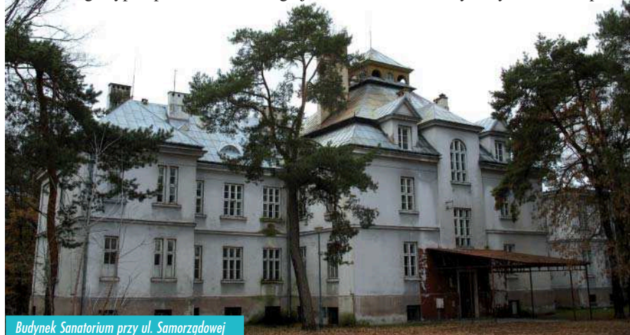
Budynek Sanatorium przy ul. Samorządowej

Przy wjeździe na teren szpitalny, po prawej stronie znajduje się niewielki, parterowy, murowany budynek, obłożony prostokątnymi płytkami. Jeszcze do niedawna na drzwiach tego budynku była tabliczka z napisem „Portiernia”. Obecnie otwory drzwiowe i okienne zostały zamurowane. Asfaltowa droga prowadzi do głównego jednopiętrowego gmachu. Jego elewację zachodnią zdobią cztery pilastry z doryckimi ornamentami oraz lukarna zakończona trójkątnym szczytem. Charakterystycznym elementem sanatoryjnego budynku, który wznosi się ponad korony sosen, jest wieżyczka zbudowana na planie kwadratu. Jej ozdobę, z każdej strony świata, stanowią trzy półokrągłe okna. W tak starannie zaprojektowanej kompozycji rzązą niechlubne „znaki czasu”: zamurowane wejście, powybijane szyby w oknach oraz zielone zacieki powstałe na skutek nieszczęsnych rynien i rur spusto-